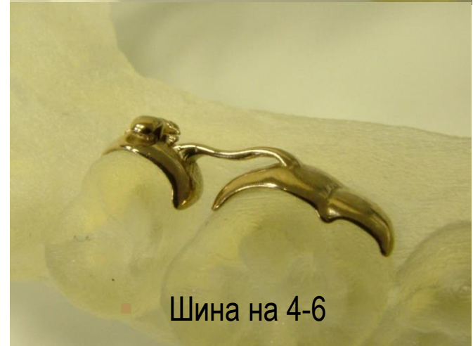
Шина на 4-6