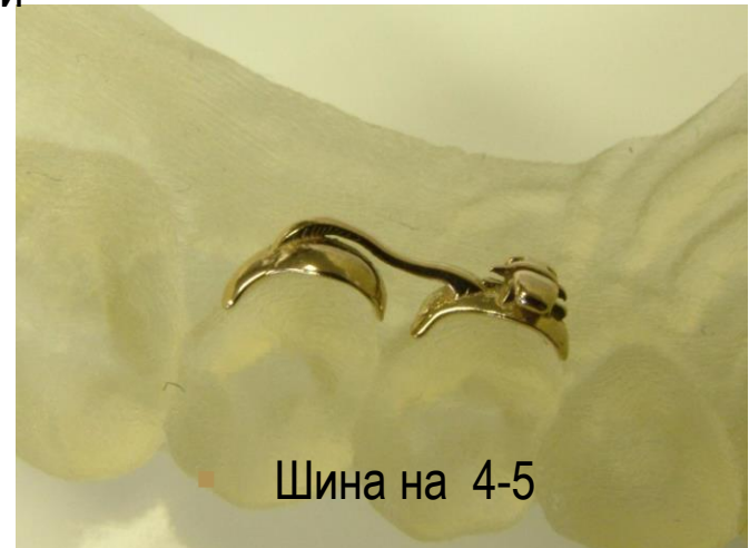
Шина на 4-5